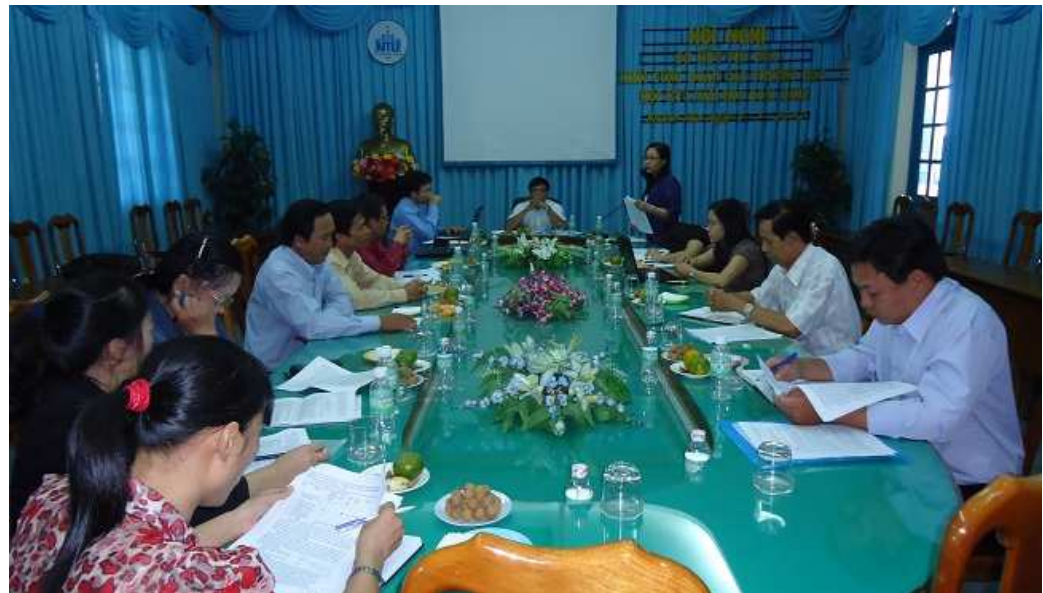
Hình ảnh về Hội nghị

Hội nghị thống nhất, bên cạnh các hoạt động thường xuyên, học kỳ II năm học 2011 - 2012, Công đoàn khối thi đua các trường học sẽ triển khai một số hoạt động quan trọng như: tuyên truyền các Nghị quyết Hội nghị Trung ương 4 khóa XI của Đảng, Luật Viên chức, tổ chức 1 số hoạt động thể thao chung chào mừng 37 năm ngày giải phóng miền Nam thống nhất đất nước (30/4/1975 - 30/4/2012) và 122 năm ngày sinh Chủ tịch Hồ Chí Minh (19/5/1890 - 19/5/2012).