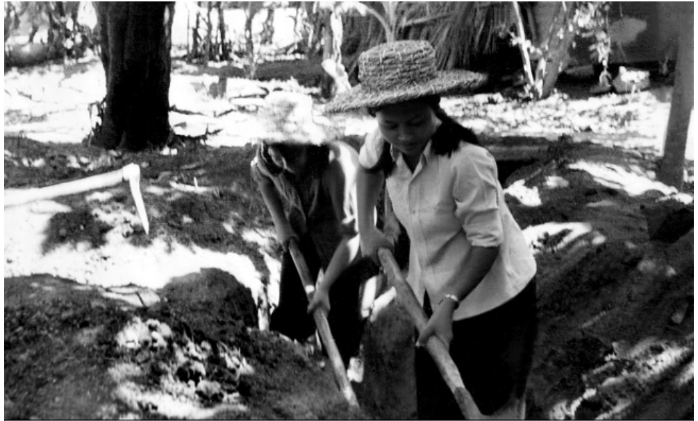
Thầy Cô và Sinh viên đào hầm chống bom trong thời kỳ Mỹ bán phá miền Bắc