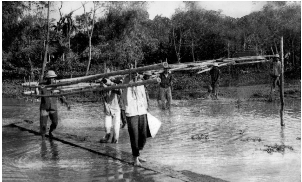
Xây dựng lớp học nơi sơ tán Hải Phòng