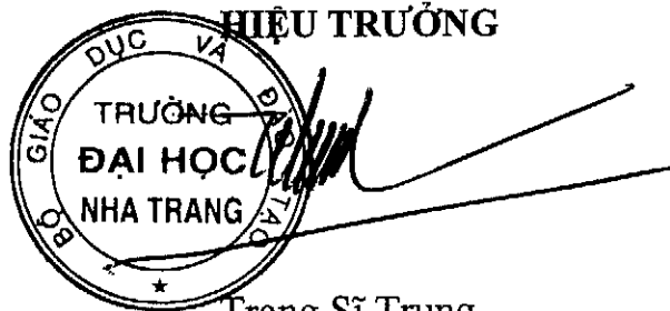
Trang Sĩ Trung