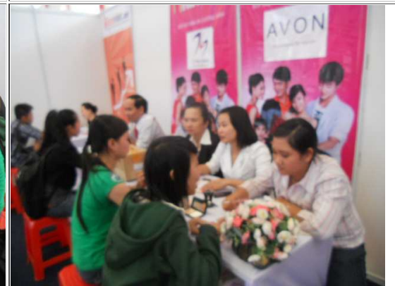
Các doanh nghiệp phỏng vấn tuyển dụng