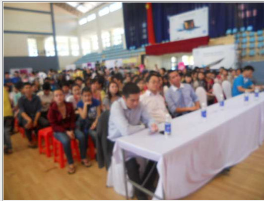
Đại diện các công ty, doanh nghiệp dự buổi khai mạc