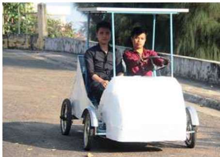
Mô hình ô tô sử dụng năng lượng mặt trời của nhóm sinh viên Khoa Kỹ thuật giao thông Trường ĐH Nha Trang

Các sinh viên Trường ĐH Nha Trang vừa nghiên cứu và thử nghiệm thành công mô hình ô tô sử dụng năng lượng mặt trời kết hợp năng lượng điện; chế tạo thành công bộ điều khiển phun xăng điện tử có thể tiết kiệm nhiên liệu gấp nhiều lần dùng cho xe gắn máy.