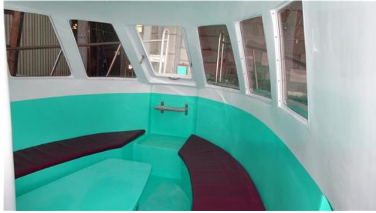
Khu vực ghế ngồi phía mũi