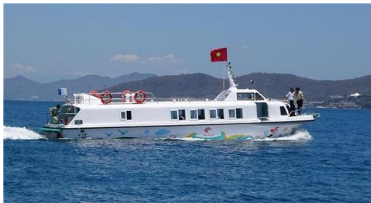
Một số hình ảnh về tàu

Kết quả chạy thử cho thấy tàu đạt yêu cầu kỹ thuật đề ra, tốc độ hành trình đạt mức 20,5 h/g, hệ số Froude F_n = 0.90 , nghĩa là tàu hoạt động ở chế độ nửa lướt. Độ ồn trong khoang khách dưới 80dB, các đặc trưng rung động (vận tốc, gia tốc, biên độ rung) đều nằm trong giới hạn cho phép.