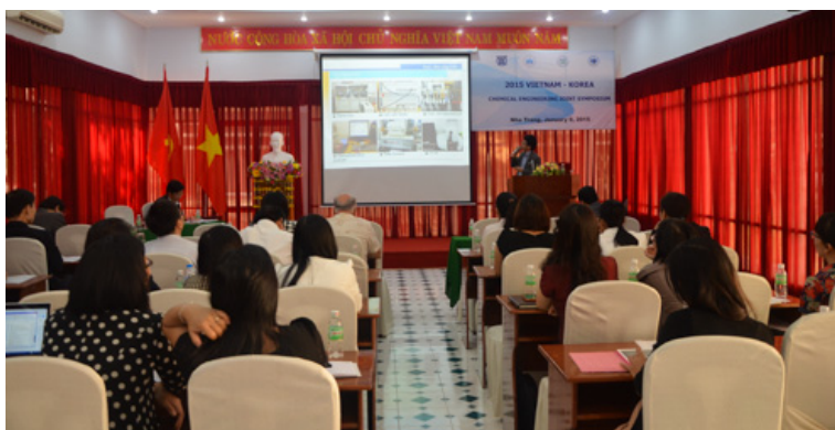
Toàn cảnh hội thảo

Sáng 09/01/2015, Trường Đại học Nha Trang phối hợp với Đại học Quốc gia Pusan, Đại học Quốc gia Pukyong, Đại học Quốc gia Seoul (Hàn Quốc) tổ chức Hội thảo khoa học Việt Nam - Hàn Quốc về lĩnh vực kỹ thuật hóa học. Gần 50 giáo sư, tiến sĩ, giảng viên chuyên ngành hóa học của Việt Nam và Hàn Quốc đã tham dự.