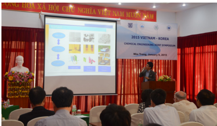
GS. Kim Seok (Hàn Quốc) trình bày báo cáo tại hội thảo