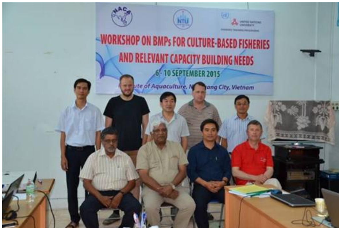
Phòng Hợp tác Đối ngoại