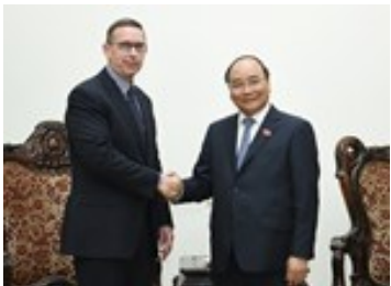
Thủ tướng mong muốn Đại học Waikato tăng