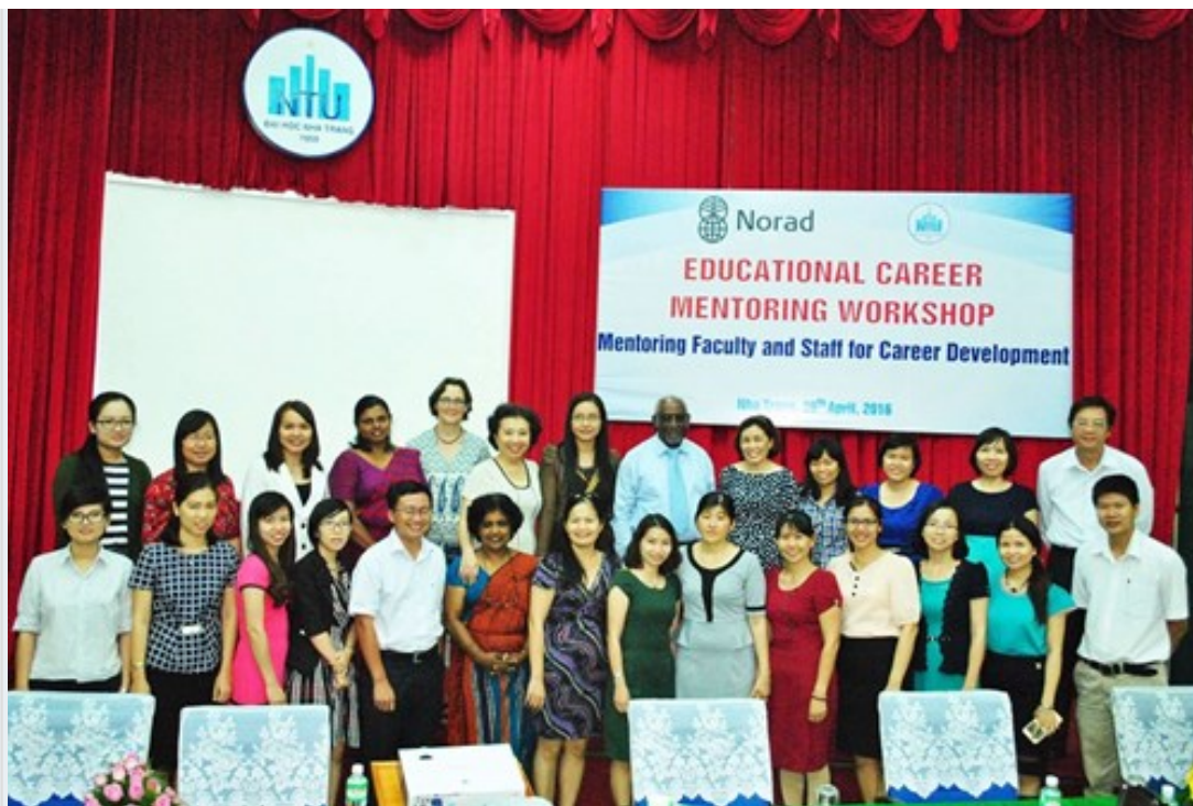
Hội thảo phát triển nghề nghiệp nữ giới.

Ngoài ra, với sự hỗ trợ của Na Uy, Nhà trường cũng đang triển khai chương trình hỗ trợ phát triển nghề nghiệp cho giảng viên nữ.