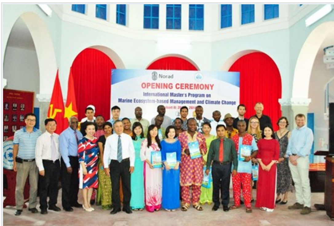
Bức ảnh chụp trong lễ khai giảng

vực như trường mầm, đại tu, môi trường, biến đổi khí hậu, quản lý năng lượng, thủy sản, quyền con người và bình đẳng giới.