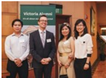
Đại sứ New Zealand trao giải thưởng cho cựu du