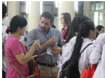
16 trường Đại học Mỹ tự giới thiệu ở Hà Nội