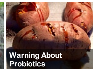
Warning About Probiotics