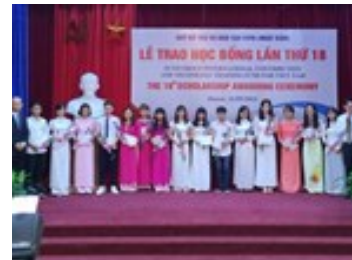
Trao học bổng Fuyo cho 80 sinh viên xuất sắc