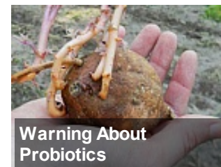
Warning About Probiotics