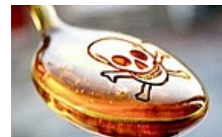
Digestive Red Flags