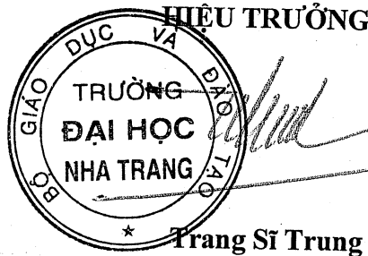
Trang Sĩ Trung